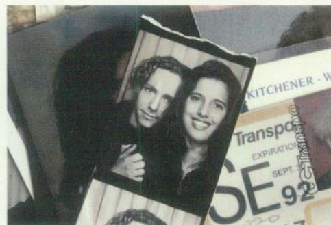
Frame dal film A Better Man .

UN CALENDARIO RICCO E ARTICOLATO CHE PROMUOVE LA DIFFUSIONE E LA CONOSCENZA DEL CINEMA "REALE".