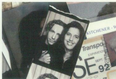
Frame dal film A Better Man .

UN CALENDARIO RICCO E ARTICOLATO CHE PROMUOVE LA DIFFUSIONE E LA CONOSCENZA DEL CINEMA "REALE".