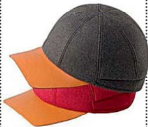
Nakagin Capsule Tower